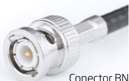
Conector BNC Universal

Consulta nuestras opciones de adaptación a otros equipos